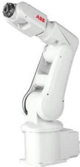
3 机 本

1. HB-JSBC-AB 技 ABB 机 本 3 。 基本 : 号 ABB IRB 120 工 级; 并 后 供 接 。 长度 常 , 电 柜 接 接。具备 件 级功 及计 机 和 进 步 功 ;